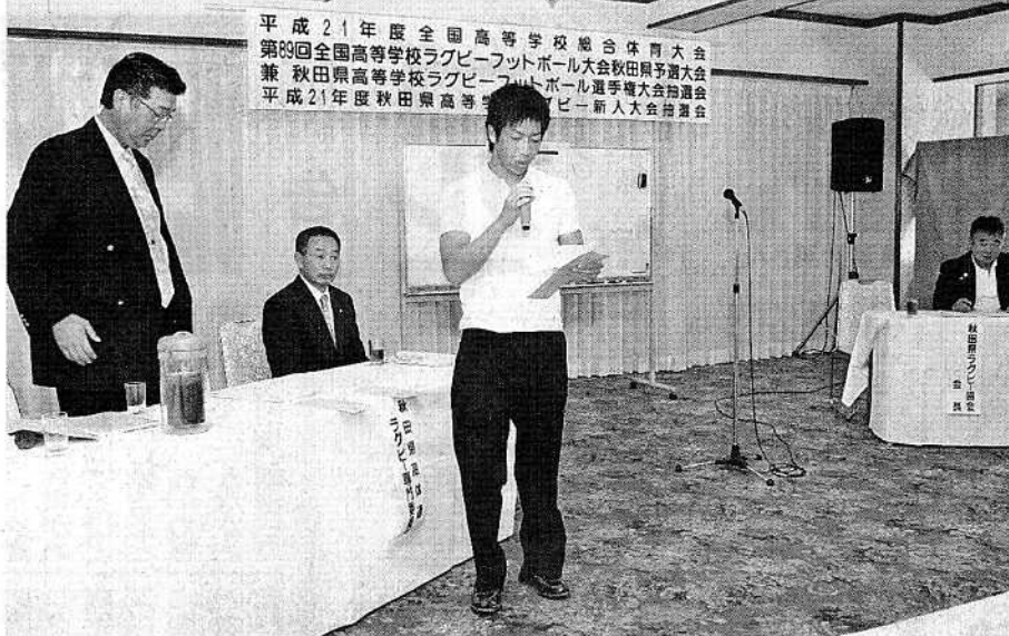
各校主将がくじ引きで対戦相手を決めた組み合わせ抽選会

平成21年度全国高等学校総合体育大会 第89回全国高等学校ラグビーフットボール大会秋田県予選大会 兼 秋田県高等学校ラグビーフットボール選手権大会抽選会 平成21年度秋田県高等学校ラグビー新人大会抽選会